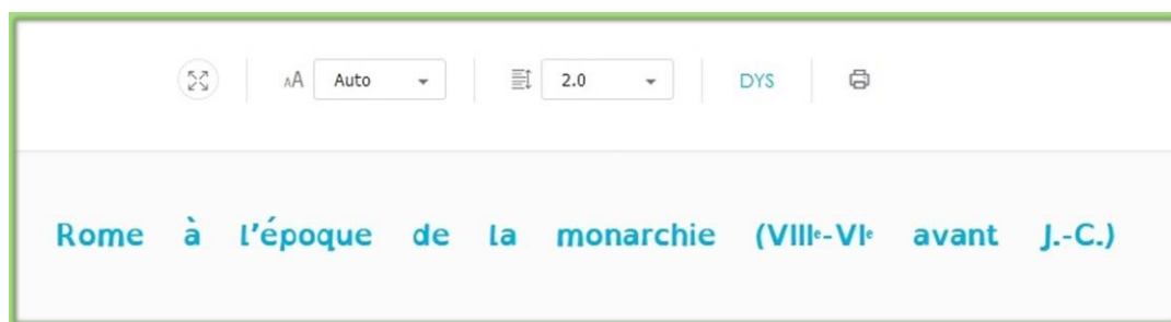
Le livre scolaire

exemple, l'éditeur « Le livre scolaire », intègre dans ses manuels en ligne, un menu avec des fonctionnalités qui permettent de réaliser des adaptations pour les Dys :