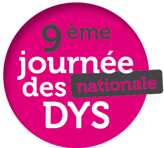
Table Ronde 2 : Le milieu ordinaire